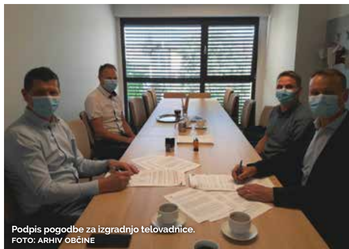
Podpis pogodbe za izgradnjo telovadnice.