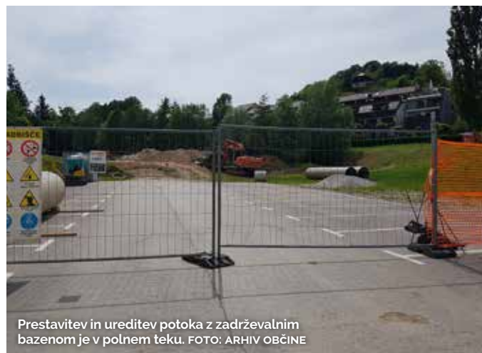
Prestavitev in ureditev potoka z zadrževalnim bazenom je v polnem teku.