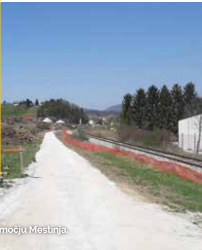
Med gradnjo nove ceste na območju Mestinja.

Je križanje javne kategorizirane ali nekategorizirane ceste, ki je v uporabi za cestni promet in železniške proge v istem nivoju, ki ne vključuje dostopov na perone in službenih prehodov.