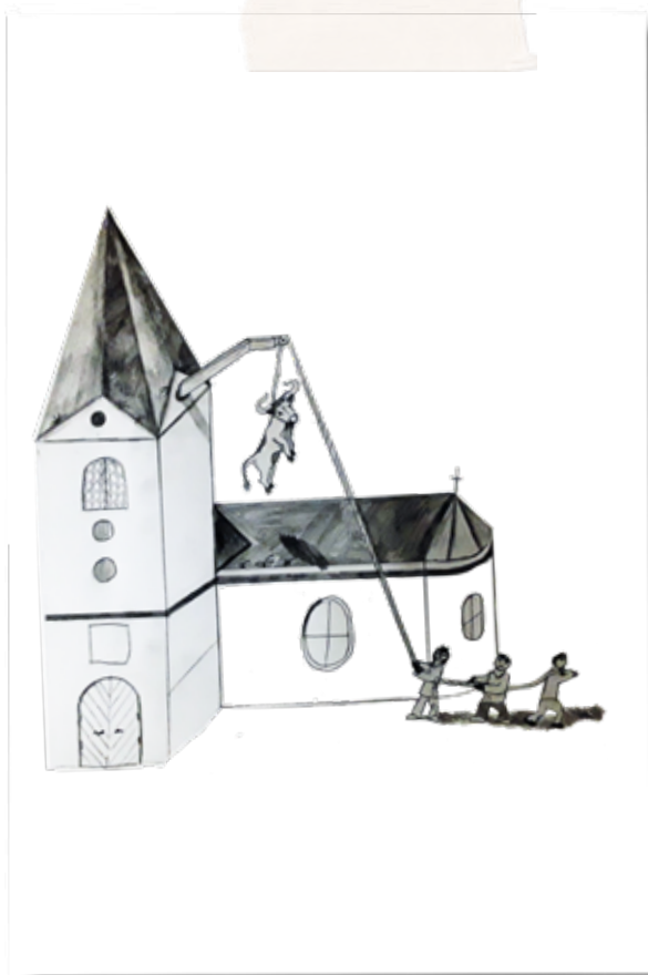
Kako so Lemberžani bika v zvonik vlekli. LUKA PUSTIŠEK