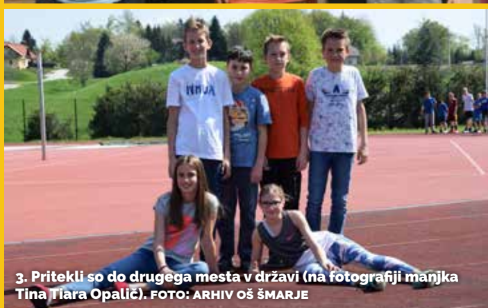
3. Pritekli so do drugega mesta v državi (na fotografiji manjka Tina Tiara Opalič).