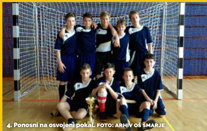
4. Ponosni na osvojeni pokal.