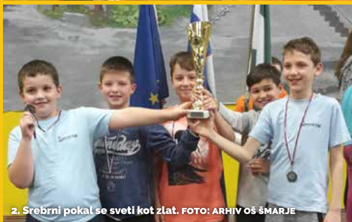
2. Srebrni pokal se sveti kot zlat.