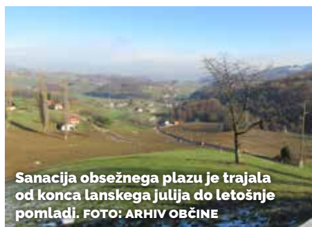
Sanacija obsežnega plazu je trajala od konca lanskega julija do letošnje pomladi.