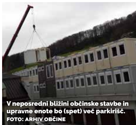
V neposredni bližini občinske stavbe in upravne enote bo (spet) več parkirišč.