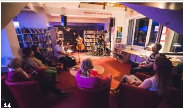
1 območno srečanje odraslih folklornih skupin, 2 prejem priznanja ob 75. obletnici delovanja NK Šmarje, 3 velikonočni lov in dan žena, 4 razstava lemberške mlinčne potice, 5 Netkova delavnica Mini Monkini joga za otroke, 6 zadnja domača tekma KK Jelša, 7 šmarska gradbišča v polnem teku, 8 otvoritev razstave Smiljana Rozmana, 9 Šentlok mednarodno tekmovanje Popinjaj, 10 potopis Tajska (Netek in KŠŠO), 11 vinski večer, 12 Šentviških 5 na obisku, 13 tekmovanje za Zlati grb, 14 koncert med knjigami