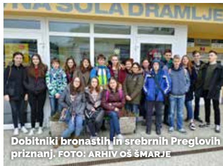
Dobitniki bronastih in srebrnih Preglovih priznanj.